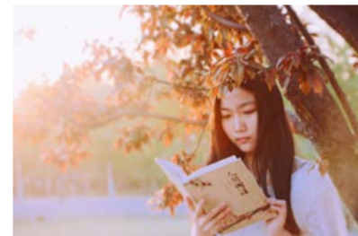
名称：《夕阳下》 奖项：二等奖 作者：马怀玉 学院：资源与材料学院 2015级 照片介绍：看一抹夕阳，得一方佳人，品一道书香，读遍《人间话语》。