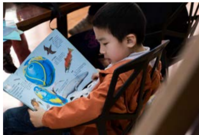
名称：《未来》 奖项：三等奖 作者：焦洁 学院：管理学院 2014级 照片介绍：高尔基说“书籍是人类进步的阶梯”，阅读正是通向未来的入口，知识改变命运，读书成就未来。 设备：佳能70d 像素：2000万