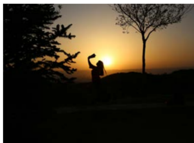
名称：《母亲》 奖项：最佳人气奖 作者：申鑫钰 学院：管理学院 2015级 照片介绍：母爱是一本书，她陪你读了你的所有，好希望可以让她陪你读完所有人生故事。