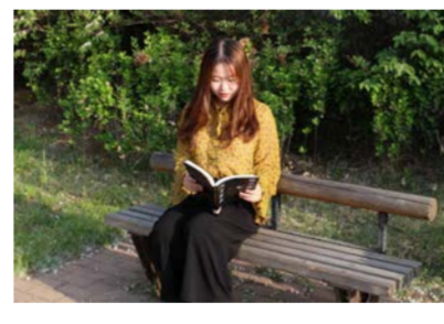
名称：《微醺》 奖项：最佳人气奖 作者：屈月 学院：经济学院 2016级 照片介绍：这是一个平常的下午，迎着微醺的阳光，她在板凳上静静地坐着，似乎看书看得入迷，这是什么书呢，书中的句子一定是像小草一般朴实而清新吧，然而这本书是《天才在左，疯子在右》。