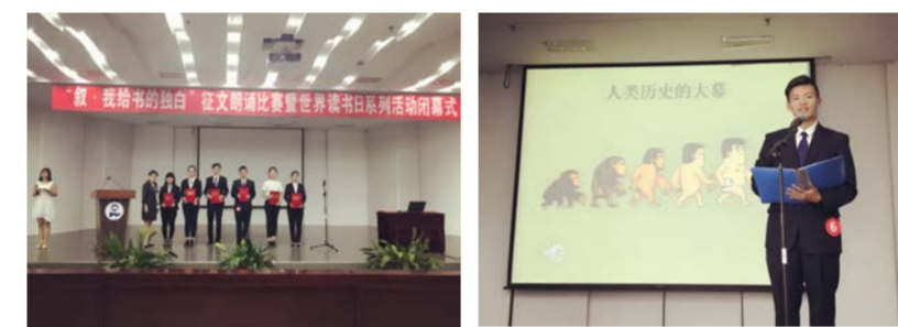
图 闭幕式中颁奖仪式

本届“恰少年书生意气,逢春日读享人生”世界读书日系列活动开展了“赏·指尖上的诗词交响”艺术讲座、“荐·我与书有个约会”阅读推荐、“读·我是最书生”每日静读、“影·寻找最美人间四月天”阅读摄影比赛和“叙·我给书的独白”征文朗诵比赛共5项活动。与往年世界读书日系列活动不同,今年图书馆联合校团委、语委办共同举办,活动内容更加丰富,参与人数增多,为广大师生奉献了精彩纷呈的文化盛宴。